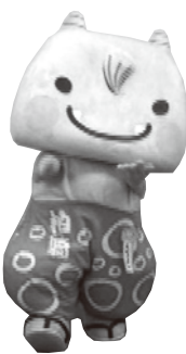
③ 右手、右足を前にだす