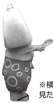
⑦ 前後の人とくっつく ※横から見た場合