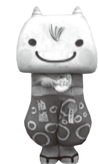
⑥ 手をあわせて腕を開く