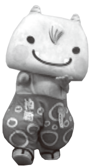
① 右手、右足を前にだす

♪ドンガラ ピッカラ ♪ドンガラ ピッカラ ♪ドンガラ ピッカラ ♪シャンカラリン ♪ドンガラ ピッカラ×3